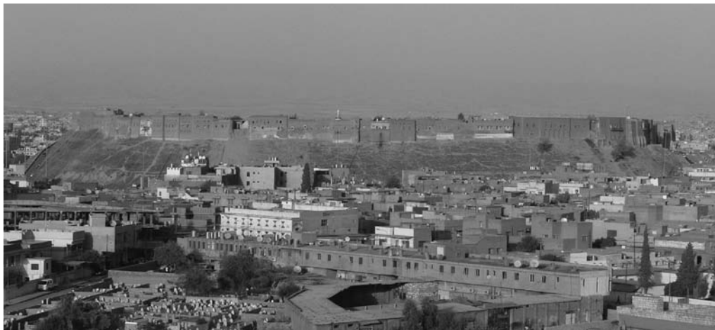
Obr. 1: Citadela v Arbílu, pohled od jihozápadu, z vrcholku tzv. Muzaffarova minaretu. Foto autor

Prameny raně islámského období dokumentují vývoj města velmi útržkovitě, z čehož se usuzuje na úpadek bývalého sásánovského centra a jeho nahrazení důležitějším Mosulem. 5 Od konce 9. století se oblast severní Mezopotámie nacházela ve stavu postupující mocenské dezintegrace, kdy ústřední správu 'abbásovského chalífátu nahrazovaly formálně podřízené, de facto však nezávislé mocenské útvary (východní emirát hamdánovského království, dynastie kurdských Marwánovců). Po dočasném sjednocení za seldžuckých Turků (po roce 1070) se region opět rozpadl do pestrého uskupení drobných emirátů, ovládaných rody lokálních atabegů: Arbíl se tak v 1. polovině 12. století stal sídlem kurdského rodu Begtegů (Baktakinů, Buktikidů), podřízeného egyptským Ajjúbovcům, s nimiž byl později i příbuzensky spjat. Za nejvýznamnějšího vladaře této dynastie se pokládá Saladinův švagr Muzaffar Dín Kokburí (1190–1232), jenž své panství odkázal přímo chalífovi al-Mustansiru. Mongolové se o dobytí Arbílu pokusili neúspěšně již roku 1237, 6 definitivně získali město až po pádu Bagdádu roku 1258 po šestiměsíčním obléhání. 7 Po roce 1534 se Arbíl stal marginální lokalitou na východní periferii Osmanské říše.